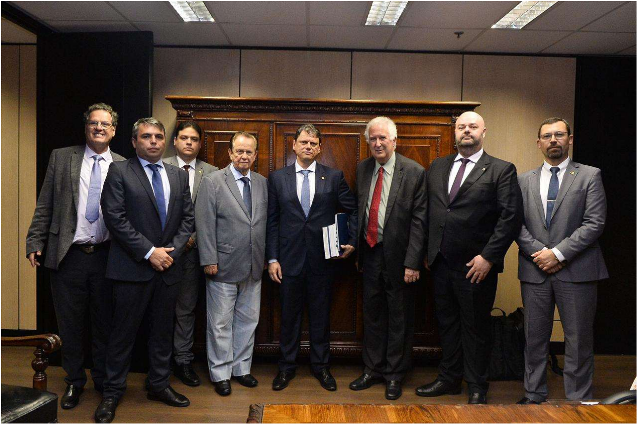
Audiência com o Ministro da Infraestrutura