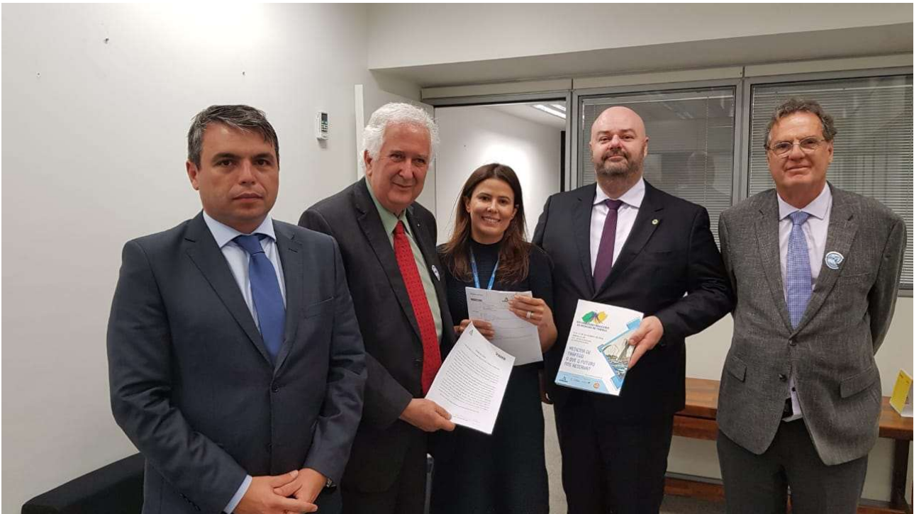
Coordenadora Jurídica do Gabinete do Senador Fabiano Contarato-ES